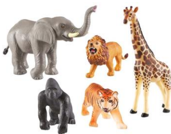
'Realistische' plastic dieren, met veel textuur