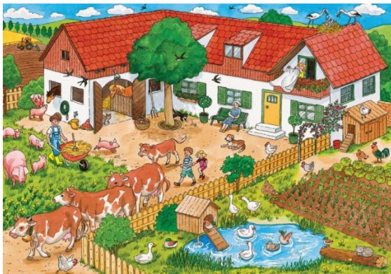
Sfeerbeelden of 'praatplaten' bij boerderijdieren